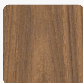
Casella Eiche braun H1386 ST40 Oberflächenstruktur Feelwood Oakgrain