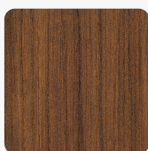
Warmia Nussbaum braun H1307 ST19 Oberflächenstruktur Deepskin Excellent