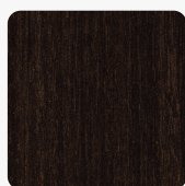
Eukalyptus dunkelbraun H3043 ST12 Oberflächenstruktur Ompipore Matt