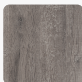
Whiteriver Eiche graubraun H1313 ST10 Oberflächenstruktur Deepskin Rough