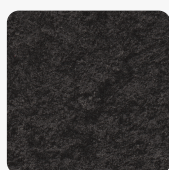
Mountain Basalt anthrazit F247 ST76 Oberflächenstruktur Mineral Rough Matt