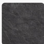
Scivaro Schiefer F235 ST76 Oberflächenstruktur Mineral Rough Matt