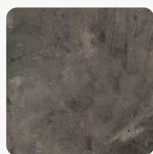
Metal Rock anthrazit F121 ST87 Oberflächenstruktur Mineral Ceramic