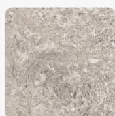
Calais Travertin F052 ST75 Oberflächenstruktur Mineral Satin