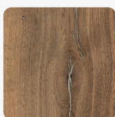
Halifax Eiche Zinn H3176 ST37 Oberflächenstruktur Feelwood Rift