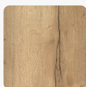
Halifax Eiche Natur H1180 ST37 Oberflächenstruktur Feelwood Rift