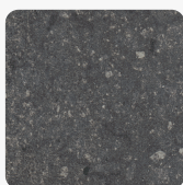
Candela Marmor anthrazit F244 ST76 Oberflächenstruktur Mineral Rough Matt