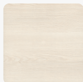
Aland Pinie polar quer H433 ST86 Oberflächenstruktur Deepskin Legno Horizontal