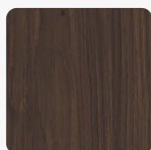
Casella Eiche Marone H1369 ST40 Oberflächenstruktur Feelwood Oakgrain