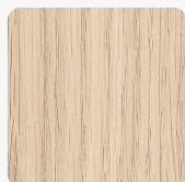
Vicenza Eiche hell H3165 ST12 Oberflächenstruktur Omnipore Matt