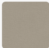
Batist 3393 GA Oberflächenstruktur Grafica