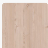
Lakeside Lärche Creme 0911 NI Oberflächenstruktur Nice