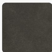
Beton Terragrau 42207 DP Oberflächenstruktur Deep Painted