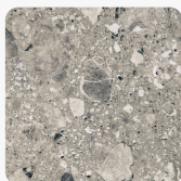
Chepe K5580 DP Oberflächenstruktur Deep Painted