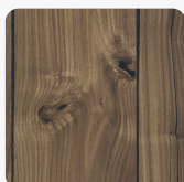
Nuss Almond Expressive K4887 AN Oberflächenstruktur Authentic Nature