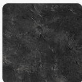
Schiefer 3953 PE Oberflächenstruktur Perl