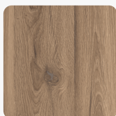
Brixen Eiche 0817 MI Oberflächenstruktur Mito