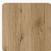
DIAMANT SKY Eiche Traunsee längs Oberflächenstruktur Furnier