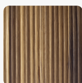
STRAIGHT Lärche geräuchert Oberflächenstruktur Furnier