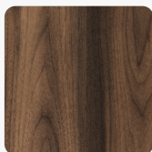
Nuss Tortona 32339 AN Oberflächenstruktur Authentic Nature