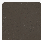
Deep Mink TH

mehr Informationen http://www.frischeis.at/shop/platte/mineralwerkstoffplatte--becken/mineralwerkstoffplatte/dupont-corian-mineralplatte-deep-mink-th-p1462970