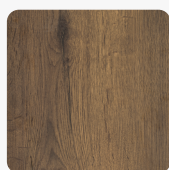
Halifax Eiche braun H3180 TM37 Oberflächenstruktur Feelwood Rift Matt