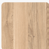
Cuneo Eiche gebleicht H3311 TM28 Oberflächenstruktur Feelwood Nature Matt