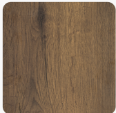
Halifax Eiche braun H3180 TM37 Oberflächenstruktur Feelwood Rift Matt