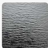
CRASHED Silver SL Oberflächenstruktur STRUCTURE-LINE