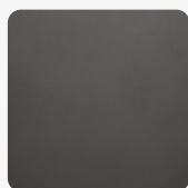
Charcoal Dark LL Oberflächenstruktur LEATHER-LINE