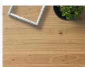
Asteiche NR Oberflächenstruktur Furnier