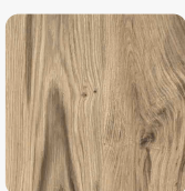
Balkeneiche Oberflächenstruktur Furnier