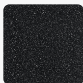
Deep Black Quartz IG

mehr Informationen http://www.frischeis.at/shop/platte/mineralwerkstoffplatte--becken/mineralwerkstoffplatte/dupont-corianr-mineralplatte-deep-black-quartz-ig-p1001726