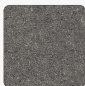
Canvas anthrazit F635 ST76 Oberflächenstruktur Mineral Rough Matt